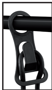
obr. 5: Závěs pro omezení tahu přívodního kabelu