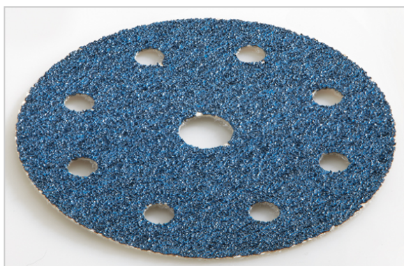
S vysokým výkonem úběru, vhodný na dřevěné a kovové podklady. Vlákna nosiče jsou extrémně odolná vůči trhání, vyznačují se velkou