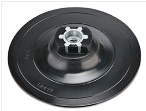
Elastický unášec se suchým zipem až do max. 12.000 ot/min.